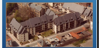
Les anciens de la DRT Alsace