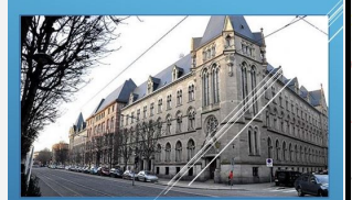
La Direction Régionale des Télécommunications d'Alsace Petite synthèse histoire de 1971 à 2006