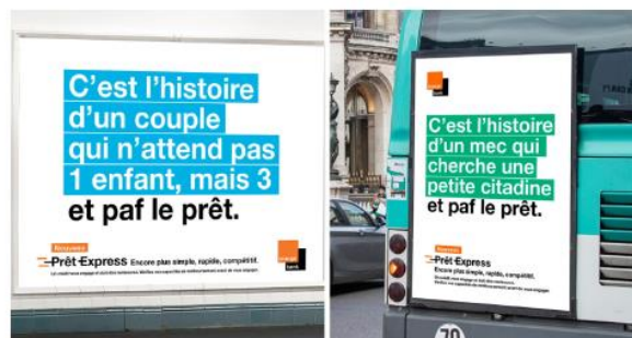
ActualitésPrintSocial mediapar Edwige Brelrier26 septembre 2022

- Orange Bank : cinq ans après, l'heure de vérité a sonné